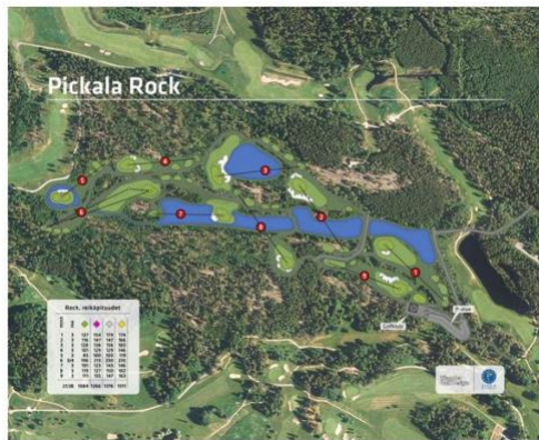
Rock-kenttä sijaitsee Katajanokan kokoisella alueella keskellä Pickalan golfkeskusta.