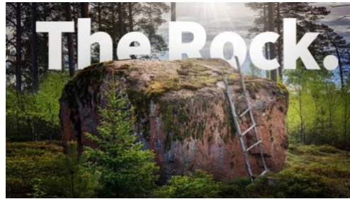
Kentän nimikkokivi sijaitsee väylän neljä vieressä.